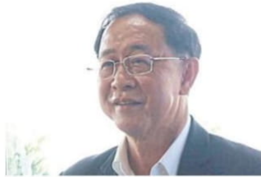
อาคม เติมพิทยาไพสิฐ

นายอาคม เติมพิทยาไพสิฐ รมว. คมนาคม เปิดเผยภายในงานสัมมนา เพื่อประเมินความสนใจของภาคเอกชน (Market Sounding) โครงการทางหลวง พิเศษระหว่างเมือง สายหาดใหญ่- ชายแดนไทย-มาเลเซีย วงเงินลงทุน 57,022 ล้านบาท ว่า จะสามารถนำ เสนอเข้าที่ประชุมคณะรัฐมนตรี (ครม.) ภายในปีนี้ ก่อนเปิดประกวดราคาใน ช่วงไตรมาสแรกของปี 2562 และ ลงนามสัญญาก่อสร้างช่วงกลางปี 2562 คาดใช้เวลา 3 ปี เพื่อเปิดให้ บริการตามแผนในปี 2565-2566