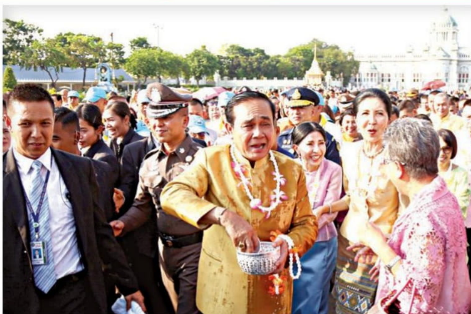
▲ สงกรานต์...พล.อ.ประยุทธ์ จันทร์โอชา นายกรัฐมนตรี และภริยาเยี่ยมชมงาน “เถลิงศกสุขสันต์ มหาสงกรานต์ ดำเนินไทย” ณ พระลานพระราชวังดุสิต

บางส่วนถ่ายภาพกับขันน้ำสงกรานต์ เรือสุพรรณหงส์ ภาวกำแพงเมืองสามมิตีพร้อมจับจ่ายซื้อสินค้าจากร้านจิตอาสา 904 แวะชิมอาหารไทย อาทิ ข้าวแช่ ขนมจีนซาวน้ำ ชมเครื่องหอมแบบไทย งานดอกไม้สด งานพับดอกบัวแบบต่าง ๆ และงานตัดกระดาษที่บริเวณพระลานพระราชวังดุสิต ก่อนพากันเดินเข้าสู่สนามเสือป่าซึ่งวันนี้มีไฮไลต์อยู่ที่กิจกรรมการตัดสินการประกวดกระทงพระเจดีย์ทรายชิงโล่พระราชทานสมเด็จพระเจ้าอยู่หัว พร้อมเกียรติบัตร ซึ่งคณะกรรมการมีเกณฑ์ตัดสินโดย