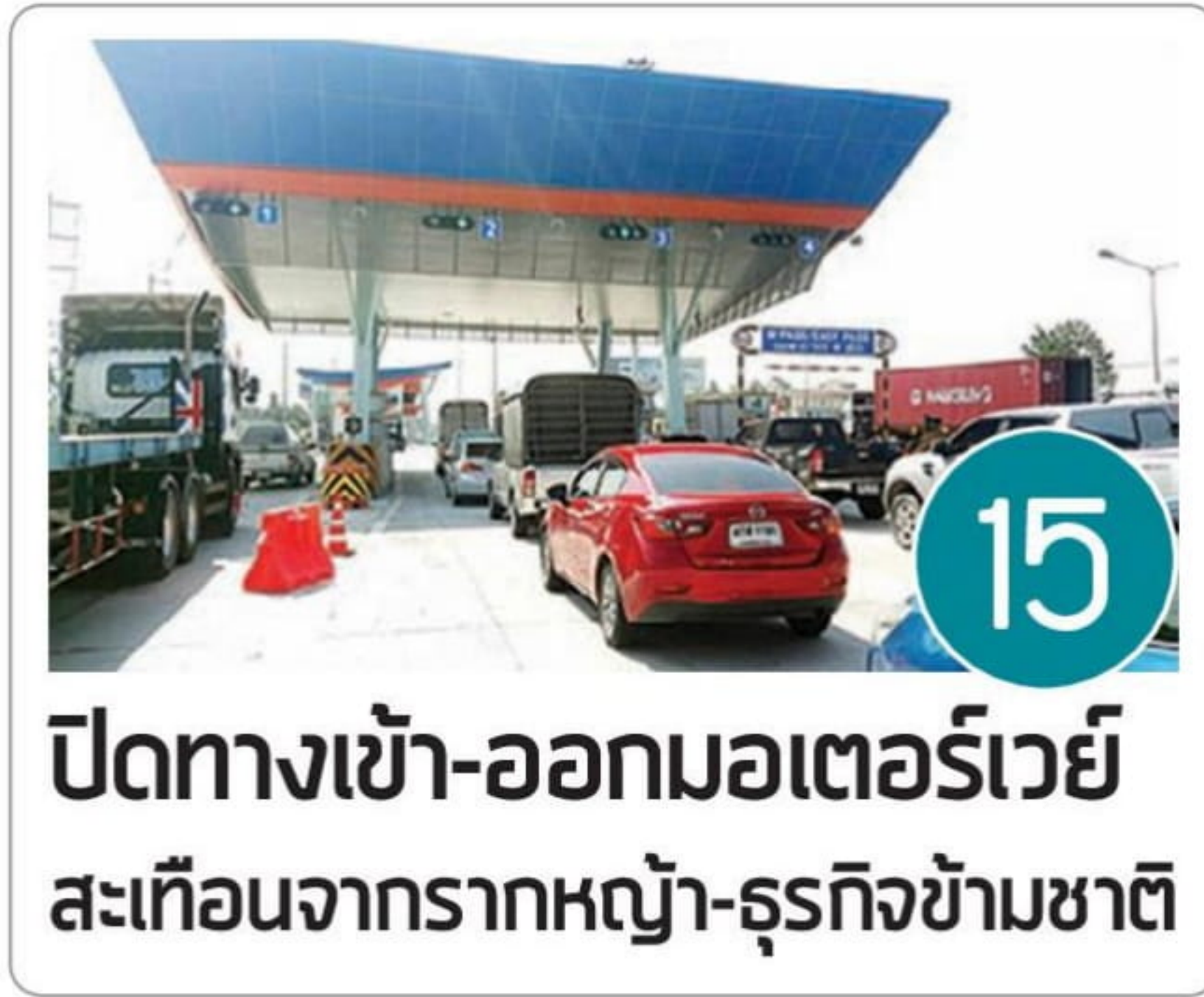
ปิดทางเข้า-ออกมอเตอร์เวย์ สะเทือนจากราคาหญ้า-ธุรกิจข้ามชาติ