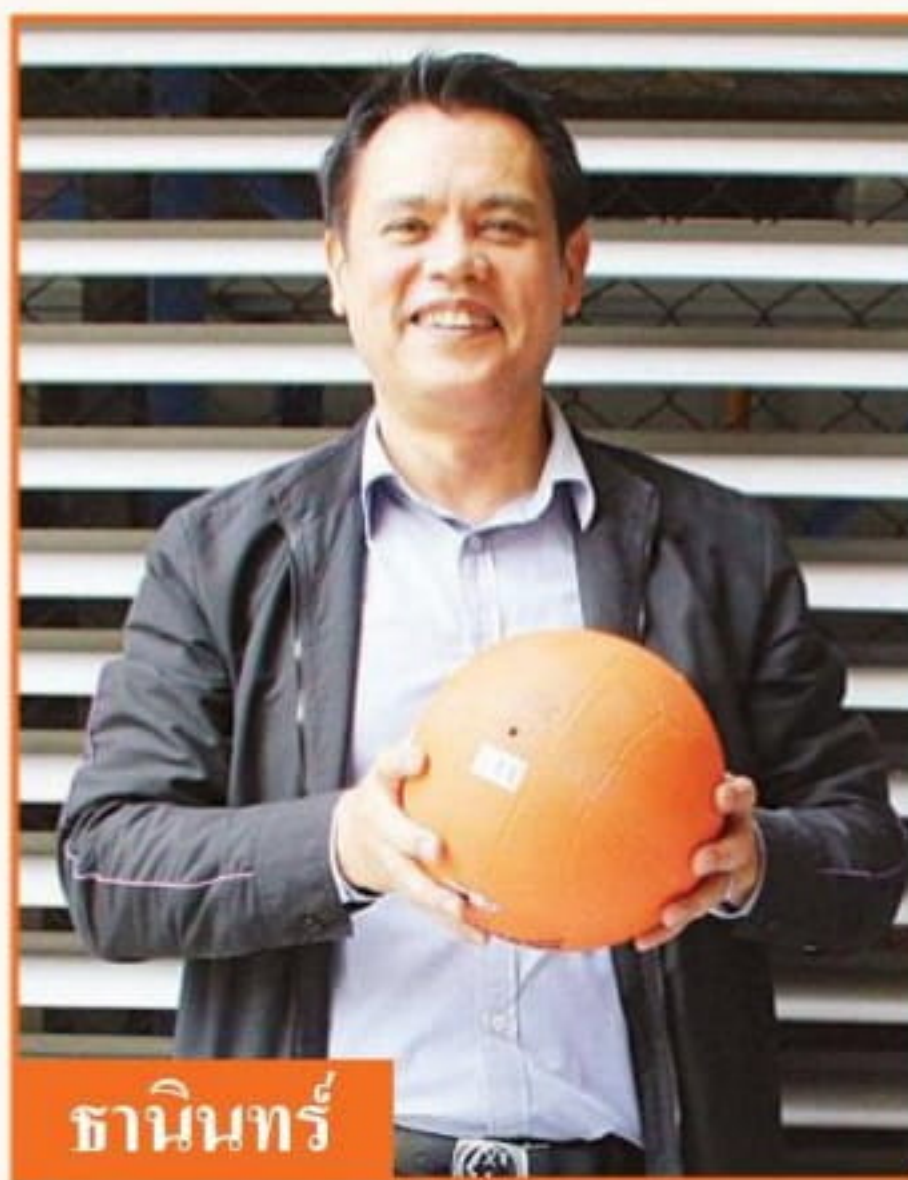
ธานินทร์

family” รวมทั้งจัดเต็มเรื่องการประชาสัมพันธ์มาตรการ 777 เข้มขันยกกำลังสาม ที่แปลว่า เข้มขันมากกกก “ตามสโลแกน” ขั้วเข้า เปิดไฟหน้า คาดเข้มขัด ผู้เกี่ยวข้องเลย โหมแคมเปญกันรัว ๆ ช่วยกันทุกช่องทาง รวมถึงการขึ้นภาพโปรไฟล์