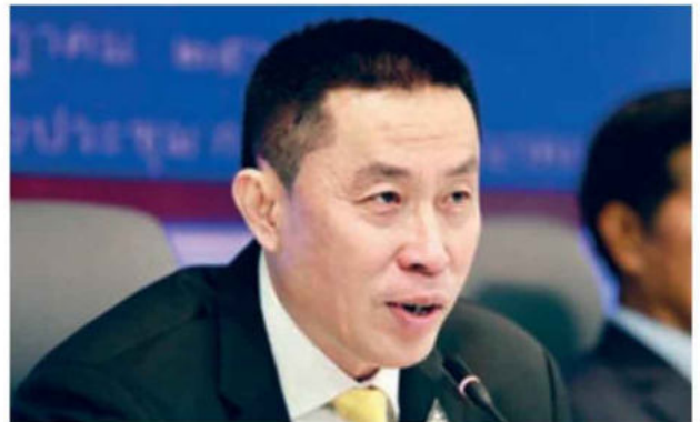
ศักดิ์สยาม วิชิตชอบ

โครงการลงทุนโครงสร้างพื้นฐานขนาดใหญ่หรือ เมกะโปรเจกต์เป็นความหวังของรัฐบาล พลเอกประยุทธ์ จันทร์โอชา ที่จะนำมาขับเคลื่อนเศรษฐกิจ ยิ่งในภาวะที่ เศรษฐกิจชะลอตัวและได้รับผลกระทบจากเศรษฐกิจโลก ยิ่งจำเป็นต้องเร่งผลักดันโดยด่วน