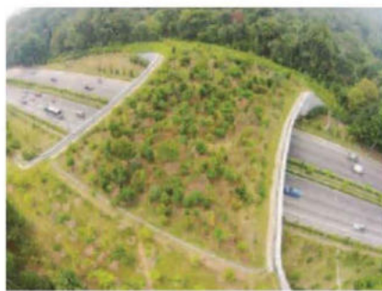
สะพานสัตว์ขนาดใหญ่ ในประเทศสิงคโปร์

พอนานเข้าก็จะเป็นปัญหาสัตว์เลือดชิด ดังนั้นจึงต้องมีช่องทางให้สัตว์มันข้ามไปมาได้ แต่ก่อนสัตว์เขาก็ข้ามกันเองตามธรรมชาติในตอนกลางคืน แต่พอรอยยะขึ้นก็มีข่าวคราวว่าสัตว์ถูกรถชนตายบ่อยขึ้น จนกระทั่งมีความเหมาะสมหลายเรื่อง ทั้งการขยายถนน สาย 304 เพื่อรองรับการเจริญเติบโตในอนาคต เชื่อมระหว่างภาคตะวันออกกับภาคอีสาน ทั้งคณะกรรมการมรดกโลกที่วางเงื่อนไขให้เราดำเนินการไม่ให้ทับลานและเขาใหญ่ถูกแบ่งโดยถนน ซึ่งในส่วนของคนที่ทำงานก็อยากได้ทางเชื่อมป่านีสักที จนมีโครงการดังกล่าว หลายปีก่อนที่มีการเสนอโครงการนี้ กรมทางหลวงให้เอกสารมาเป็นปี มีภาพ