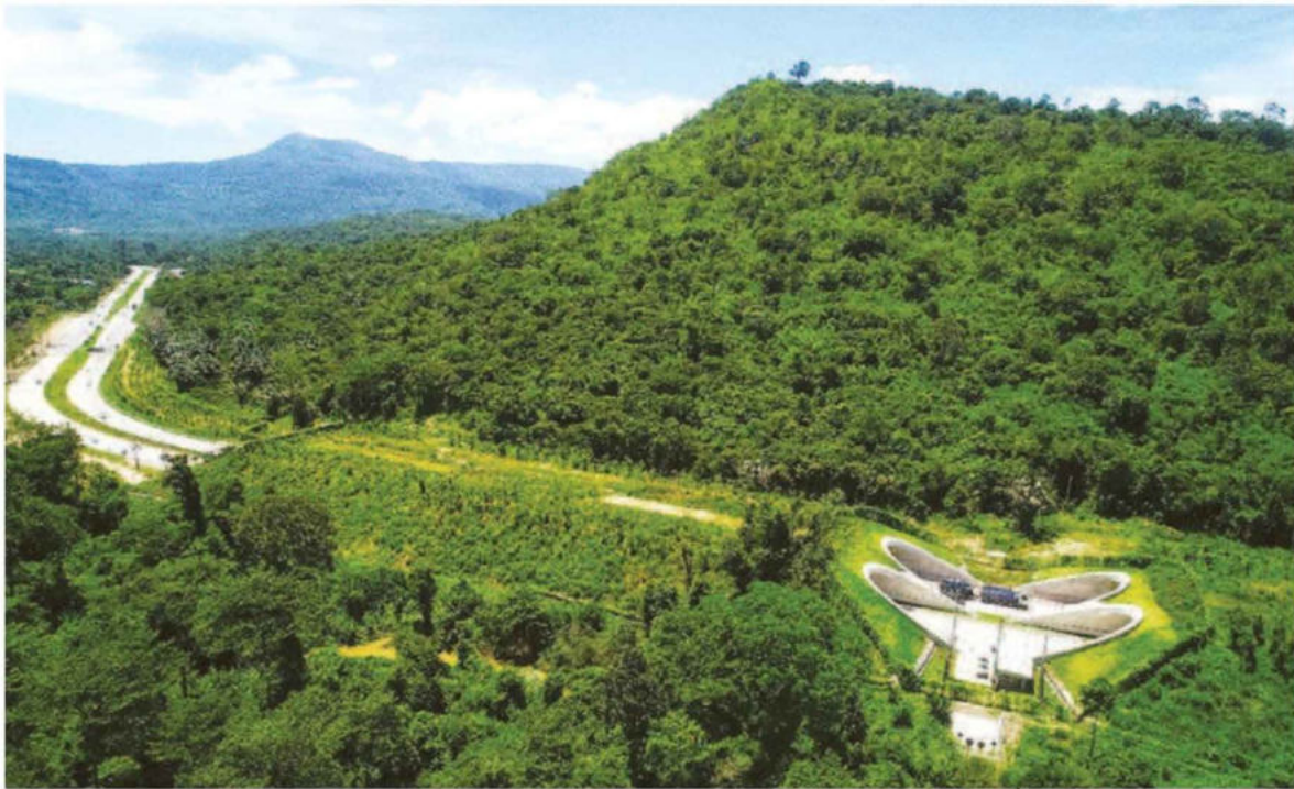
อุโมงค์สัตว์ข้าม ถนน 304