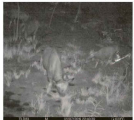
สัตว์ป่ามาใช้ทางลอดและกางจ้าง

มีรายละเอียดโครงการเบื้องต้น โดยโครงการทางเชื่อมผืนป่ามรดกโลก ระหว่างอุทยานแห่งชาติเขาใหญ่ กับอุทยานแห่งชาติทับลานนี้ เป็นการขยายถนนสาย 304