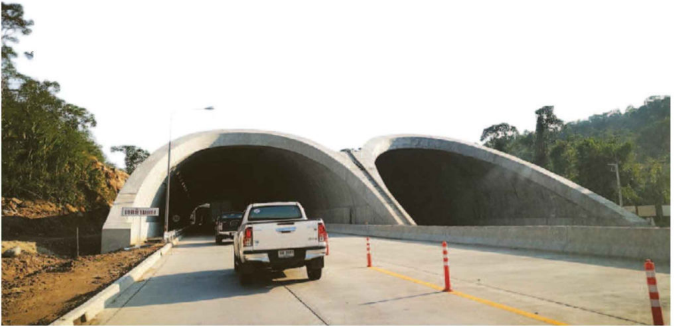
อุโมงค์ ที่สัตว์จะเดินข้ามด้านบน