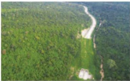
ถนน 304 ที่ตัดผ่านพื้นที่มรดกโลก

พอนานเข้าก็จะเป็นปัญหาสัตว์เลือดชิด ดังนั้นจึงต้องมีช่องทางให้สัตว์มันข้ามไปมาได้ แต่ก่อนสัตว์เขาก็ข้ามกันเองตามธรรมชาติในตอนกลางคืน แต่พอรอยยะขึ้นก็มีข่าวคราวว่าสัตว์ถูกรถชนตายบ่อยขึ้น จนกระทั่งมีความเหมาะสมหลายเรื่อง ทั้งการขยายถนน สาย 304 เพื่อรองรับการเจริญเติบโตในอนาคต เชื่อมระหว่างภาคตะวันออกกับภาคอีสาน ทั้งคณะกรรมการมรดกโลกที่วางเงื่อนไขให้เราดำเนินการไม่ให้ทับลานและเขาใหญ่ถูกแบ่งโดยถนน ซึ่งในส่วนของคนที่ทำงานก็อยากได้ทางเชื่อมป่านีสักที จนมีโครงการดังกล่าว หลายปีก่อนที่มีการเสนอโครงการนี้ กรมทางหลวงให้เอกสารมาเป็นปี มีภาพ