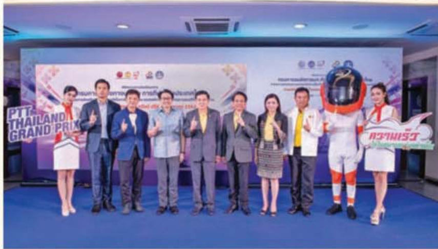
ประกาศความพร้อมลูบปีที่ 2 ต้องดีกว่าเดิม