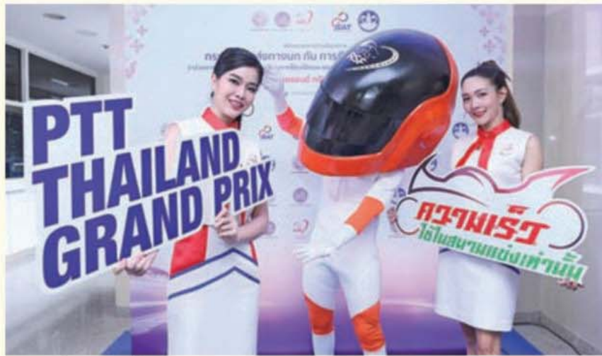
รถแข่งโครงการซิปซีปลอดภัย

"การเป็นเจ้าภาพจัดการแข่งขันมอเตอร์สปอร์ตระดับโลกในประเทศไทย ส่งผลให้มีผู้ชมเดินทางมาจากทั้งในและต่างประเทศ โดยส่วนใหญ่เดินทางโดยโครงการซิปซีทางบก ฉะนั้น กรมการขนส่งทางบกจึงเป็นหน่วยงานสำคัญมาก ที่ให้การสนับสนุนทั้งในเรื่องการอำนวยความสะดวก และความปลอดภัยของเส้นทาง นอกจากนี้ยังมีโครงการความร่วมมือระหว่างกันในการรณรงค์การซิปซีปลอดภัย ซึ่งทาง กทท. ต้องขอขอบคุณอีกครั้งที่ทางขนส่งทางบกเห็นความสำคัญ และให้ความร่วมมือในการจัดงานครั้งนี้"