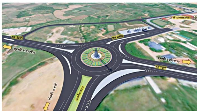
ภาพจำลองรูปแบบทางแยกบริเวณจุดสิ้นสุดโครงการ

รูปแบบเป็นทางหลวงแนวใหม่ ขนาด 4 ช่องจราจรไป-กลับ แบ่งทิศทางด้วยเกาะกลางแบบร่อง (Depress Median) มีจุดตัดทางแยก 3 แห่ง ได้แก่ 1.บริเวณจุดเริ่มต้นโครงการแยกนาโป่ง (แยกร้านอาหารบ้านหนองโอง) 2.จุดตัดทางหลวงชนบท ลย.4026 และ 3.จุดสิ้นสุดโครงการซึ่งได้นำงานภูมิสถาปัตยกรรมมาใช้โดยมีแนวคิดมาจากการจำลองต้นดอกไม้บ้านอาฮี อ.ท่าลี่ เพื่อบ่งบอกถึงอัตลักษณ์ท้องถิ่นความเป็น อ.ท่าลี่