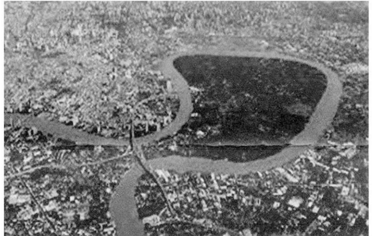
บางกะเจ้า ป่าล้อมเมืองสมุทรปราการ เมืองอยู่ในอ้อมกอดของป่า

แน่นอน...นิเวศและสิ่งแวดล้อม ต้นไม้ เรือกสวนไร่นาที่มีอยู่ ก็ถูกทำลายไปด้วยเช่นกัน สมุทรปราการ