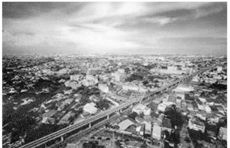
สมุทรปราการเมืองในป่าคอนกรีต