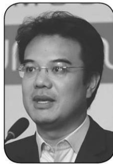
ปริณญ์ พานิชศักดิ์

ข้าวสารบ้านเมืองก็ดูเหมือนจะร้อนแรงพอๆ กัน โดยเฉพาะชาวหญิงสาวหลายรายแจ้งความตักเตือนนักท่องเที่ยวชื่อดัง ล่วงละเมิด ตามมาด้วยนักสืบโซเชียลที่ต่างซุดคุ้ยข้อมูลในอดีตของนักการเมืองรายดังกล่าวออกมาแฉกันเป็นระลอก จากนั้น “ปริณญ์ พานิชศักดิ์” อดีตรองหัวหน้าพรรคประชาธิปัตย์ จึงแฉลงข่าวชี้แจงสั้นๆ บริเวณหน้าที่ทำการพรรค ปฏิเสธข้อมูลที่ถูกกล่าวหา และขอต่อสู้ในกระบวนการยุติธรรม พร้อมประกาศลาออกจากทุกตำแหน่งในพรรค ด้านเจ้าหน้าที่ตำรวจรวบรวมพยานหลักฐานเตรียมออกหมายจับ และเฝ้าระวังการหลบหนีออกนอกประเทศ แต่เจ้าตัวพร้อมทนายความได้เข้าพบพนักงานสอบสวนที่ สน.ลุมพินีทันที