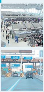
ก.ทศ. กว. รับมือ 'สงกรานต์ 65' ปลดล็อก ปชช. เดินทาง ระดมความพร้อม 'บท นำ ราง อากาศ' สะดวก-ปลอดภัย