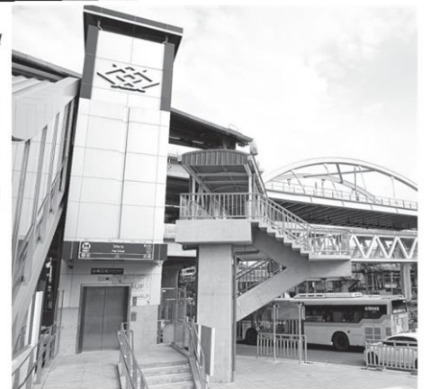
678 กม. รวมเบ็ดเสร็จกว่า 3,200 กม. ทั่วประเทศ สำหรับรถไฟความเร็วสูงปีนี้ มี 2 โครงการ

ขณะที่รถไฟทางคู่ในปี 65 จะเสร็จสิ้นระยะแรก 1,111 กม. อนุมัติโครงการระยะที่ 2 อีก 7 โครงการ 1,483 กม. และก่อสร้างทางรถไฟสายใหม่ 2 เส้นทาง