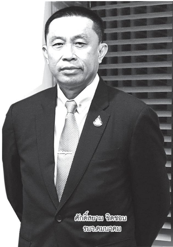
ศักดิ์สยาม ชิดชอบ รมว.คมนาคม

“ตั้งแต่เข้ามาเป็น รว.คมนาคม เมื่อวันที่ 30 ก.ค.62 ที่ผ่านมา ได้เร่งเดินหน้าลงทุนโครงสร้างพื้นฐานมาตลอด และในขณะนี้ก็มีโครงการที่แล้วเสร็จเปิดให้บริการ อยู่ระหว่างดำเนินการ รวมทั้งโครงการจะเริ่มดำเนินการจำนวนมาก ซึ่งทั้งหมดนี้จะช่วยให้ชีวิตความเป็นอยู่ของคนไทยสะดวกสบาย ปลอดภัยขึ้น รวมทั้งยังรองรับการเป็นศูนย์กลางในการค้า ดึงดูด