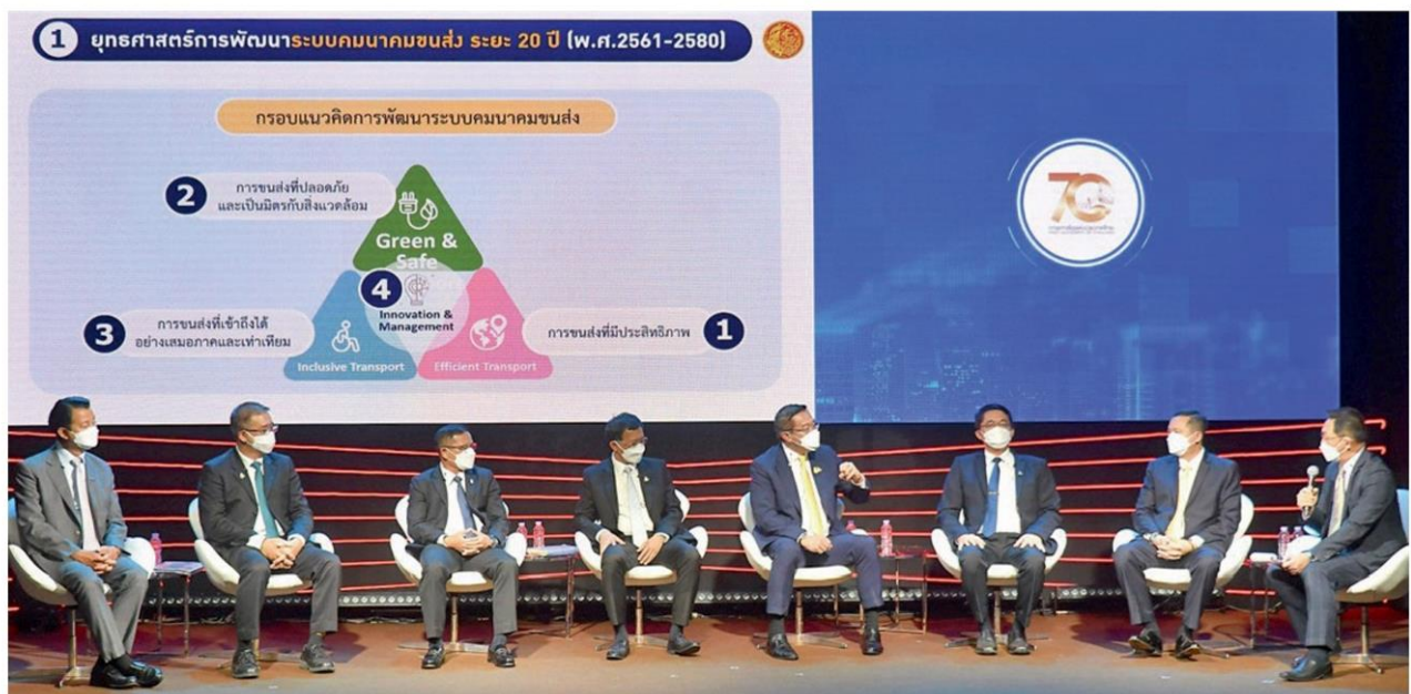
นายชยธรรม์ พรหมศร ปลัดกระทรวงคมนาคม บรรยายนำในหัวข้อ เปิดแผนคมนาคม เปิดประเทศ ขับเคลื่อนอนาคตไทย จากนั้นตามด้วยผู้บริหารระดับสูงจากกรม รัฐบาลกิจและหน่วยงานภายในกระทรวงคมนาคม

การประกาศเปิดประเทศภายใน 120 วัน ตามนโยบาย พล.อ.ประยุทธ์ จันทร์โอชา นายกรัฐมนตรี และรัฐมนตรีว่าการกระทรวงกลาโหม เป็นสัญญาณให้ทุกภาคส่วนได้รู้ทิศทางประเทศจากนี้ และทุกภาคต้องเตรียมพร้อมกันอย่างไรบ้าง เพื่อร่วมกันขับเคลื่อนเศรษฐกิจและประเทศชาติ