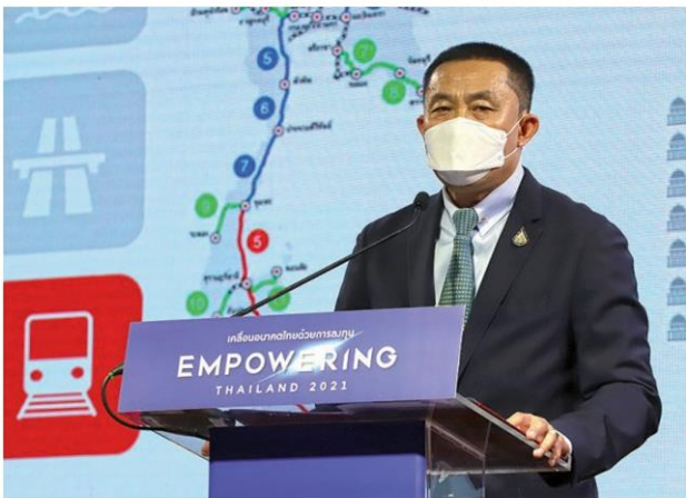
นายศักดิ์สยาม ชิดชอบ รัฐมนตรีว่าการกระทรวงคมนาคม ปาฐกถาพิเศษ

นายชยธรรม์กล่าวไว้ว่า แผนการพัฒนาโครงสร้างพื้นฐานด้านคมนาคมไทย แบ่งเป็น 2 มิติ คือ นโยบายหลักมาจากรัฐบาล หรือการสั่งการของนายกรัฐมนตรี ลงสู่กระทรวงคมนาคม ก่อนแปลงมาเป็นนโยบายของกระทรวงคมนาคม ส่วนใหญ่เป็นนโยบายระยะยาว ที่เตรียมแผนไว้ก่อนเกิดการระบาดโควิด-19 ดังนั้นนโยบายภาพใหญ่จึงไม่มีการเปลี่ยนแปลง ขณะที่การระบาดโควิดเป็นเหมือนการเกิดอุบัติเหตุ เป็นสิ่งที่ไม่คาดคิด ต้องพยายามแก้ไขปัญหาก่อน อาทิ กำหนดเปิดประเทศรับนักท่องเที่ยวต่างชาติใน 120 วัน ก็ได้รับนโยบายทุกอย่างให้ประเทศไทยกลับมาแข็งแกร่งเร็วกว่าประเทศอื่น ซึ่ง 8 กรม และ 11 รัฐวิสาหกิจในคมนาคมต้องทำงานร่วมกันให้การขนส่งคน และขนส่งสินค้า จากต้นทางไปสู่ปลายทาง ผ่านระบบ 4 มิติ คือ