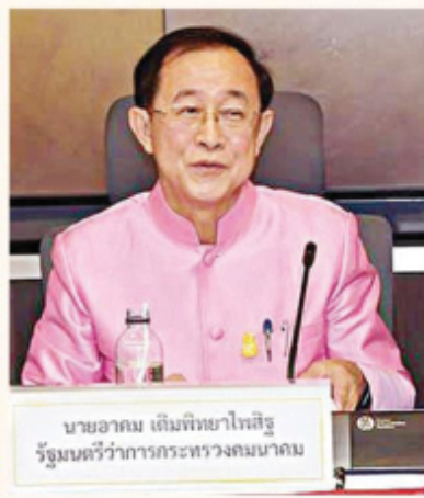
นายอานน ปิณฑรรตนา รัฐมนตรีว่าการกระทรวงคมนาคม

●●● ประมอธรว ำ ให้ อากม เดิมพิทยไพลฐ รว.คณมคม ที่เลื้อน พิธีเปิดสะพานเข้าทำอากาศยานดอนเมือง ตัวใหม่บริเวณหน้าอาคารระหว่างประเทศ จากกำหนดเดิม เข้าวันจันทร์ที่ 12 พ.ย.นี้ มาเป็นวันอาทิตย์ที่ 11 พ.ย. เวลา 14.30 น. แทน ●●● เพราะกลัวว่าพิธีเปิดจะสร้าง ปัญหาการจราจรติดขัดเช้าวันแรกของการ ทำงาน เดียวจะถูกชาวบ้านตั้งคำถาม เหมือนพิธีเปิดอุโมงค์ทางลอดแยกรัช โยธินเช้าวันจันทร์ที่ 5 พ.ย.ที่ผ่านมา... “มันใช้เวลาเปิดน้อยยย?? เลยเลื้อน มาเปิดวันหยุดช่วงการจราจรเบาบางแทน