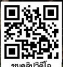
ชมศิลปินสี่