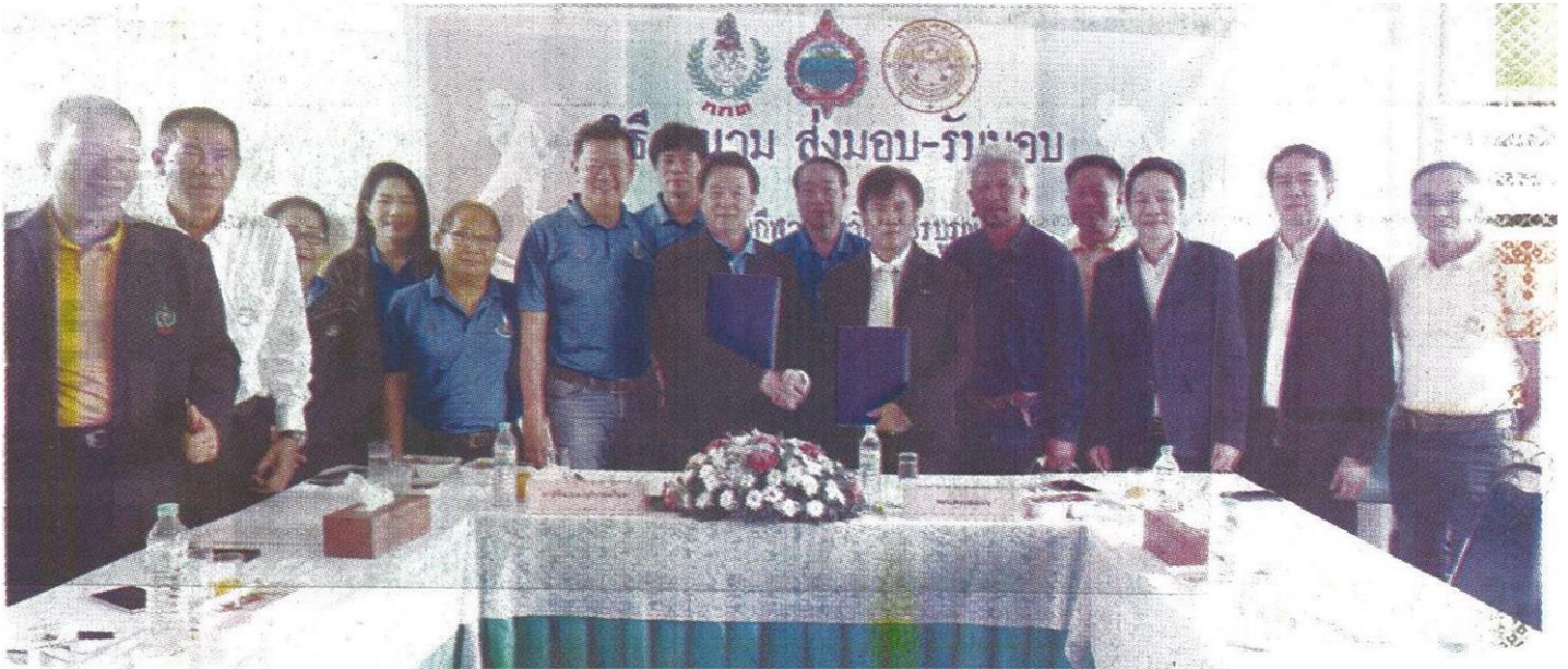
"กกท." รับมอบสนาม จ.เพชรบูรณ์ พร้อมบริการ-จัดกีฬาต้นท่องเที่ยว

ตามที่การกีฬาแห่งประเทศไทย (กกท.) ร่วมกับกรมทางหลวง ลงนามบันทึกความร่วมมือโครงการก่อสร้างสนามกีฬาจังหวัด 7 แห่ง ประกอบด้วย มหาสารคาม, สระแก้ว, สมุทรปราการ, อ่างทอง, นครราชสีมา, เพชรบูรณ์ และนครราชสีมา พร้อมด้วยศูนย์ฝึกกีฬาแห่งชาติ 1 แห่ง ที่ อ.มวกเหล็ก จ.สระบุรี